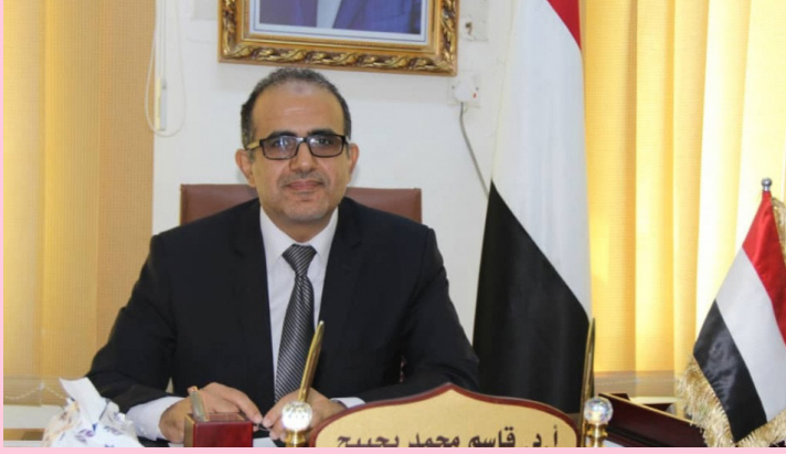
عدن / الأقربازين

رفع معالي الدكتور قاسم محمد بحبيح وزير الصحة العامة والسكان بريقة تهنئة إلى النساء العاملات في القطاع الصحي بمناسبة اليوم العالمي للمرأة الثامن من مارس جاء فيها: إلى كل الزميلات العزيزات العاملات في الحقل الصحي طبيبات وممرضات وقابلات وعاملات في التخصصات الطبية المختلفة اجدها فرصة طيبة لتهنئتك بمناسبة اليوم العالمي للمرأة الثامن من مارس الذي يحل علينا هذا العام ونحن نسير بخطى وثيقة نحو التعافي للقطاع الصحي الذي تشكلن احد اهم اعمدته والذي سيصل بكن وبقية الزملاء إلى الغايات المرجوة التي نرسمها للخروج بالقطاع الصحي إلى الفضاءات الرحبة والارتقاء به ليعمل على تقديم الدور المناط به على الوجه الأمثل أن الاحتفاء بعيدك هو التفاتة إنسانية رائعة ننتهزها لتهنئتك ومن خلالك نهني كل نساء العالم متمنيا لكن موفور الصحة والسلامة دمتن بخير