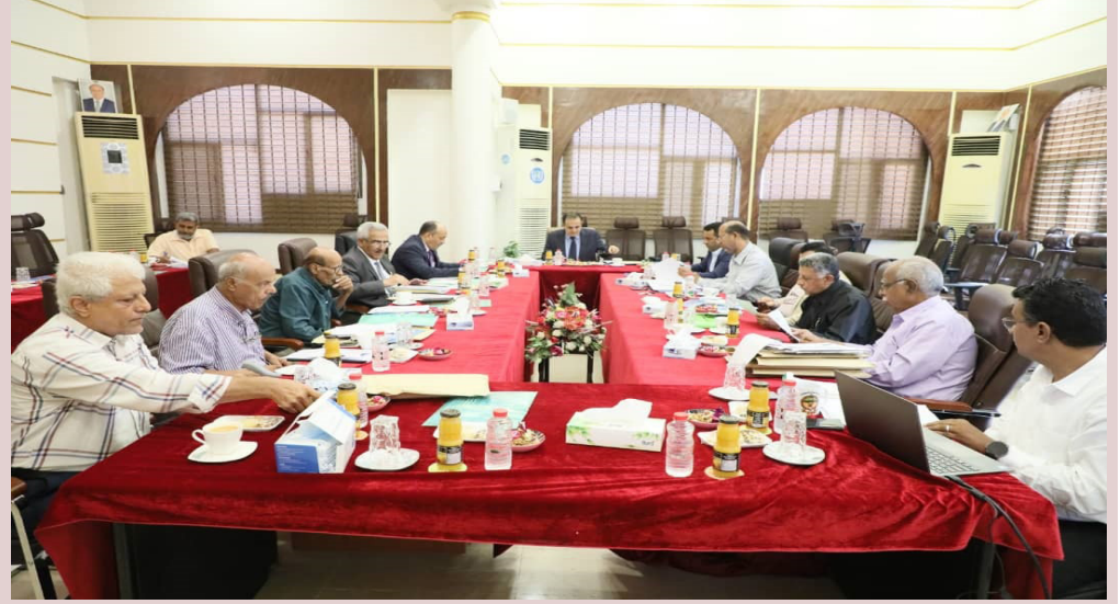
عدن / الأقربازين

ومخاطر الاستخدام العشوائي له دون الحاجة .. مؤكداً الحاجة على تفعيل دائرة البحوث والإعلام الدوائي وإظهار دور الهيئة وأحداث فاروق في مجال البحث الدوائي وطالب بحبيح بضرورة تعزيز النشاط الإعلامي الموجه للمجتمع وتعزيز عمل إدارة الرقابة والتفتيش وتكثيف أدائها وبراظه إعلامياً والالتزام بشروط الجودة والأسعار. ووضع آلية محددة في التعامل مع الأدوية المراقبة دولياً وتجنب التعاطي معها إلا من خلال وصفة طبية معتمدة من الأطباء الاختصاصيين الذين يحق لهم صرفها... مشيراً إلى ضرورة إنشاء نظام معلومات على قدر من الكفاءة المهنية وربط الهيئة بفروعها من خلاله لتحسين الأداء والمعلومة والرقم الاحصائي والسير باتجاه اعداد الخطط المتصلة بالتدريب والتأهيل النوعي التخصصي الذي يستفاد منه في مختلف الإدارات المدير العام التنفيذي للهيئة الدكتور عبد القادر احمد البكري استعراض أنشطة الهيئة الحالية وما تم انجازه خلال العام المنصرم والخطط والبرامج لها للعام الجاري وكذا تطلعات الهيئة المستقبلية نائب وزير الصناعة المستشار سالم الوالي الذي شارك في الاجتماع اشاد بمستوى التنسيق بين الهيئة ووزارة الصناعة في مجالات منح التراخيص وتسجيل الشركات .. تداخلت أخرى لعدد من الاعضاء صبت جميعها باتجاه الرفع من كفاءة الأداء النوعي في الهيئة وتسجيل حضور فاعل لها في الامسك بزمام السوق الدوائية