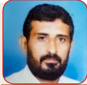
يكتبها: نبيل عليوة

اصدار النشرات العلمية الدوائية والقيام بالبحوث والتقيف الدوائي والاشراف على الاعلام والترويج الدوائي وابداء الراي بالمضمون للنشرات الدوائية