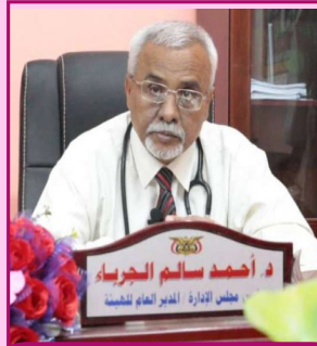
يكتبها: د/ احمد الجرياء

اصدار النشرات العلمية الدوائية والقيام بالبحوث والتقييف الدوائي والاشراف على الاعلام والترويج الدوائي وابداء الراي بالمضمون للنشرات الدوائية