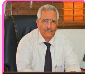
بقلم / المشرف العام

حضر اللقاء الدكتور / حسين الاعوش الوكيل المساعد لقطاع الطب العلاجي بوزارة الصحة