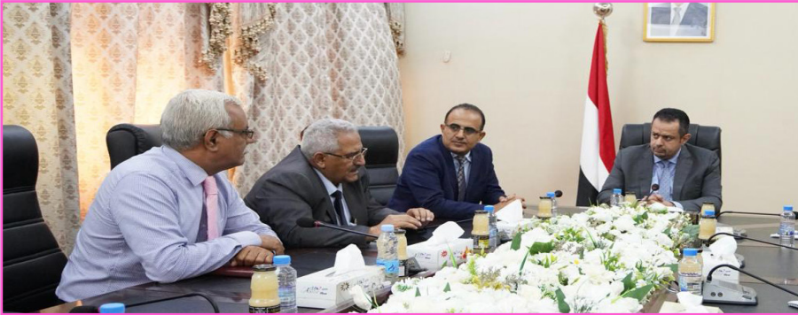
عدن / الأقربازين