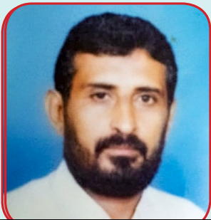
يكتبها نبيل عيوبة

اصدار النشرات العلمية الدوائية والقيام بالبحوث والتقييف الدوائي والاشراف على الاعلام والترويج الدوائي وابداء الراي بالمضمون للنشرات الدوائية