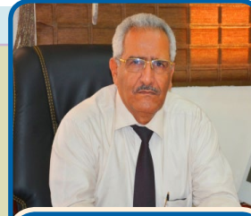
بقلم / المشرف العام