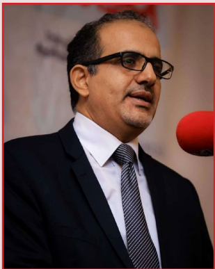
عدن / الأقربازين